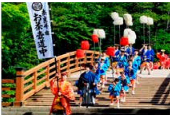
毎年6月に行われる中山道奈良井宿のお茶壺道中

毎年、都留市や静岡市など各地で、このお茶壺道中を再現した観光行事が行われている。