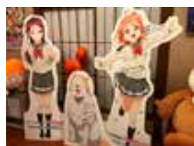
ロビーにあったパネル

この旅館は人気アニメ番組「ラブライブ」の登場人物の実家として設定されているらしい。彼らはその熱狂的なファンであり、聖地巡礼としてここに投宿しているのだ。