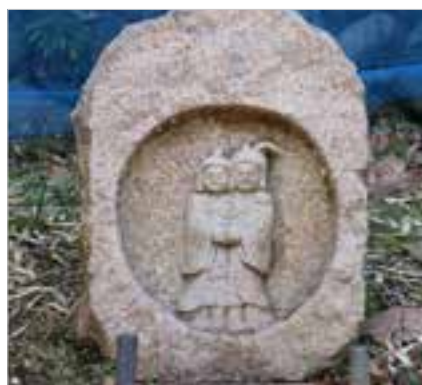
微笑ましい「上屋の道祖神」

りゆつくり。再び車道に戻り、しばらくすると道端には微笑ましい「上屋の道祖神」が迎えてくれました。