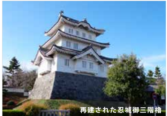
再建された忍城御三階櫓

平成二二年三月、埼玉、群馬、栃木三県を巡るガイド協会の研修旅行に参加し、鉢形城・沼田城・名胡桃城・唐沢山城・忍城の五つの城を見学した。それぞれに思い出がある中で、旅の締めくくりに訪れた「忍城」を選びました。